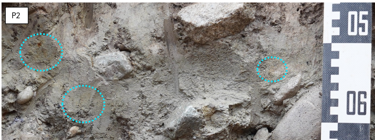
Abbildung 1: P2) hier wurde «gg» hinzugefügt. Aufsteigen von Wasser durch Kapillarität. Sand besteht überwiegend aus Quarzkörnern und ist daher eisenarm. Oxidationsprozesse können deshalb nicht stark ausgeprägt sein.

Einige Korrekturen wurden in Bezug auf die Oxidationsmerkmale vorgenommen, wie die folgenden Beispiele illustrieren (Abbildungen 1 und 2).