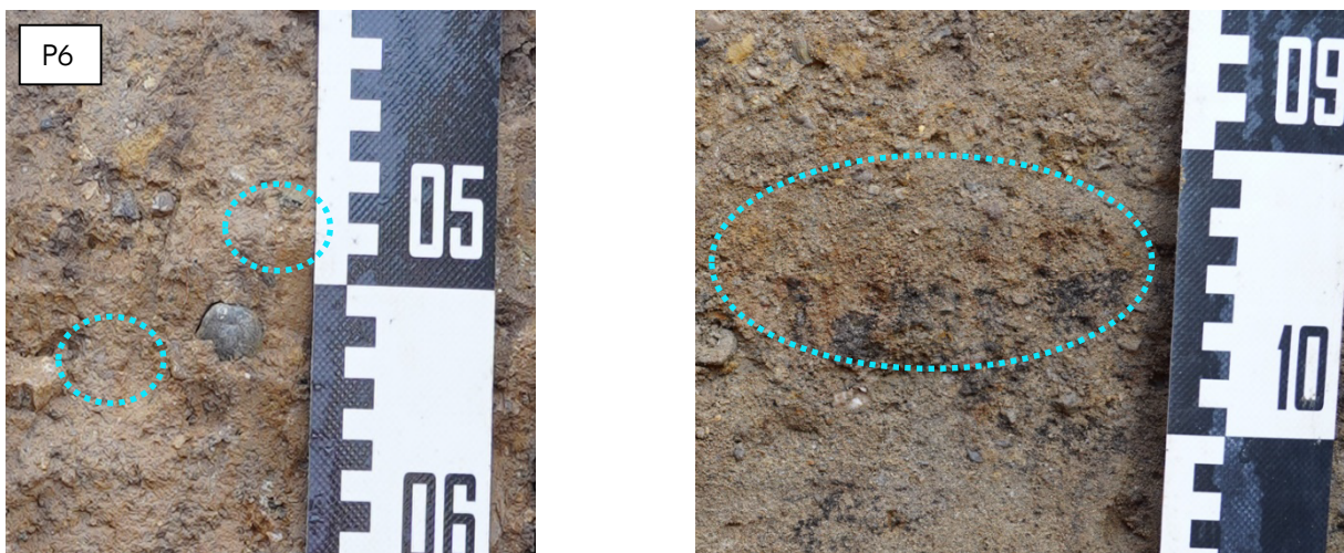
Abbildung 2: P6) hier wurde «g» hinzugefügt. Die intensive Trockenheit der Profile erschwerte die Beobachtung der Oxidationsmerkmale. Jedoch erscheinen sie lokal recht deutlich. In diesem Profil sind die Rostflecken ziemlich stark konzentriert, aber nur lokal, deshalb wurde ein «g» statt «gg» vergeben.